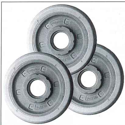
Friktionsscheiben der PolyDisc Serie-100

Neben den Produkten, die bereits in «mittex» 3/99, S. 17–18, beschrieben wurden, präsentierte Heberlein Fasertechnologie als Neuheit die Friktionsscheiben der PolyDisc Serie-100. Diese Scheiben sind bei Standardeinsatzgebieten bis Geschwindigkeiten von 900 m/min einsetzbar. Die Scheiben der Serie-200 erlauben Texturiertgeschwindigkeiten bis zu 1100 m/min. Beide Produktreihen zeichnen sich durch ein interessantes Preis-/Leistungs-Verhältnis aus. Durch die hohe chemische und mechanische Beständigkeit weisen die neuen Friktionsscheiben eine lange Lebensdauer auf.