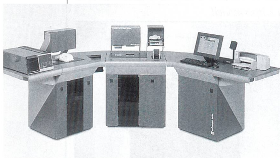
Fig 1: USTER® HVI SPECTRUM

The USTER® HVI SPECTRUM analyses and classifies samples of cotton bales according to international trading standards within a very short period of time. It is designed to facilitate cotton purchasing and bale management for daily mix selection. The integrated bale management software USTER® BMS is included in the basic installation as well as USTER® QUALIPROFILE. This enables the spinning mill to quickly determine if there are exception bales in their cotton shipments and to account for variations before they affect the finished product. Bale test results also can be compared easily to USTER® STATISTICS.