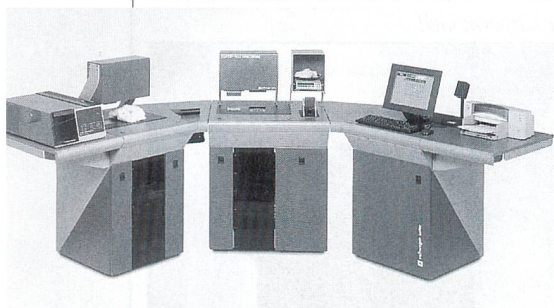
Fig 1: USTER® HVI SPECTRUM

The USTER® HVI SPECTRUM analyses and classifies samples of cotton bales according to international trading standards within a very short period of time. It is designed to facilitate cotton purchasing and bale management for daily mix selection. The integrated bale management software USTER® BMS is included in the basic installation as well as USTER® QUALIPROFILE. This enables the spinning mill to quickly determine if there are exception bales in their cotton shipments and to account for variations before they affect the finished product. Bale test results also can be compared easily to USTER® STATISTICS.