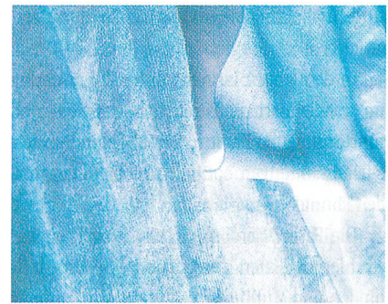
Abb. 1: Vliesstoff aus Rhovyl'As antibacterial für Matratzenabdeckungen

BIOKRYL und BIOKRYL PLUS können problemlos mit Naturfasern wie Baumwolle, Wolle, aber auch Viskose und Lyocell gemischt werden, ohne deren fühlbare Eigenschaften und Merkmale zu beeinträchtigen. Auch als Mischung für synthetische Fasern wie Polyacryl, Polyester und Polyamid können sie verwendet werden. Die Anwendungsgebiete reichen von Putz- und Wegwerftüchern, um die gegenseitige Infizierung verschiedener Flächen zu verhindern, bis zum Einsatz als Filter, um die in der Luft schwebenden Bakterien und Pilze zu reduzieren. Weiterhin tragen die Fasern dazu bei, die auf feuchten Stoffen entstehenden Gerüche zu