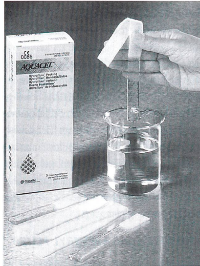
Bild 1: Queen's Award for Technological Achievement. Testen der Saugfähigkeit von Hydrocel

oder verwoben werden. Zur Behandlung von Wunden wird eine spezielle CMC-Faser, die sogenannte Hydrocel-Faser, angeboten. Für diese