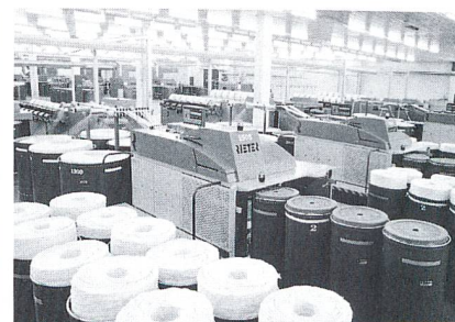
Abb. 2: Die Regulierstrecke RSB-D 30

Mit dem ComforSpin®-Verfahren setzt Rieter neue Massstäbe. Das com4®-Garn (Abb. 1) eröffnet Kunden neue Möglichkeiten in der Gestrick- und Gewebegestaltung. Es besticht durch geringe Haarigkeit, hohe Garnfestigkeit und Dehnung sowie einer deutlich verbesserten Ökobilanz in der Herstellung. Erstmals wird