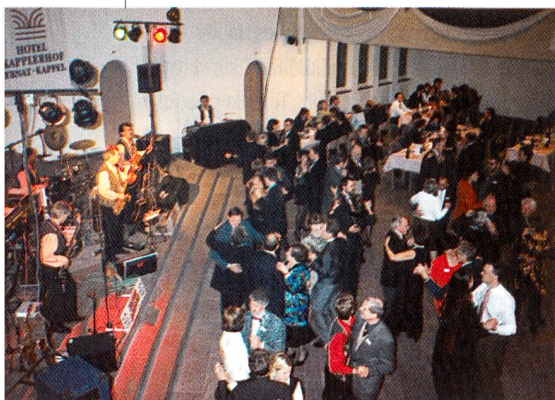
Impressionen vom Textil-Ball 1997

Open end – Verlängerung in der Weyschono-Bar