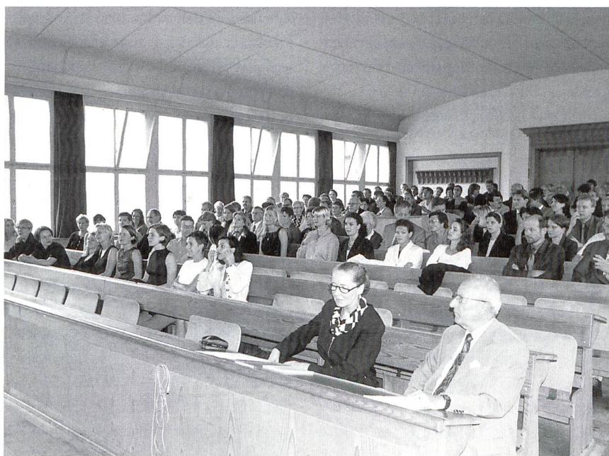
Diplomierung im Juli 1998 an der STF in Wattwil.