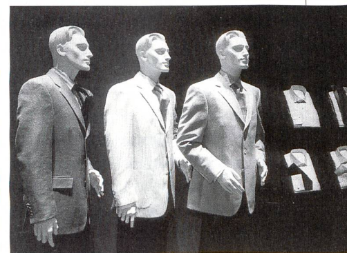
Hemdenpräsentation auf der Herren-Mode-Woche, Juli 1998.

Belebt aber nicht zu wild präsentiert sich der Hemdenbereich. Farblich abgesetzte Paspeltauchen lanciert Knock Out, grosse bunte Block-