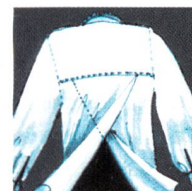
Über- und Untertritt

Den Ansprüchen von Frauen wird man weitgehend durch die Verwendung von modischen Stoffen und entsprechender Schnittgestaltung gerecht. Hier stehen Hemdkleider, Kleiderröcke, Wickel- und Wendewickelröcke sowie Schlupfhosen mit funktionellen Details zur Erleichterung der Bewegungseinschränkung der Träger zur Verfügung.