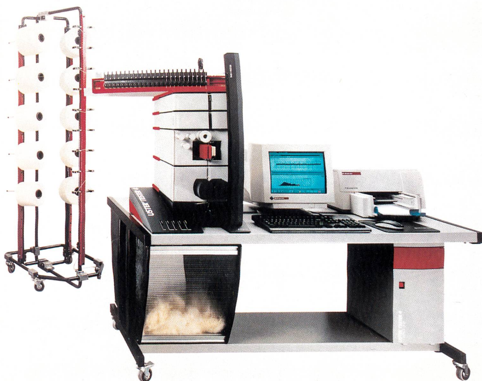
Abb. 1: USTER® TESTER 4-SX

diesem Grund stellt Zellweger Uster nun den neuen USTER® TESTER 4 vor, ein Garngleichmässigkeitsprüfgerät der nächsten Generation.