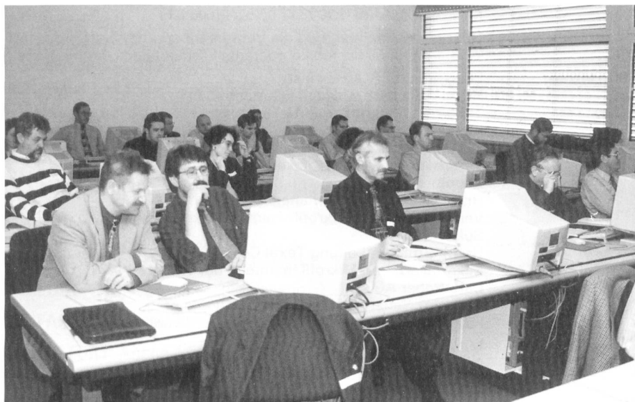
Die Teilnehmer am Weiterbildungskurs

Deshalb ist es sehr wichtig, dass sich eine Firma, welche sich mit dem Gedanken beschäftigt aufs Internet zu gehen, seriös darauf vorbereitet. Welche Produkte und Dienstleistungen sollen angeboten werden, welche Informationen sollen auf der HomePage dargestellt werden, wie soll die HomePage gestaltet werden, wer soll angesprochen werden (Zielgruppen) und wer betreut, pflegt und unterhält die Home-