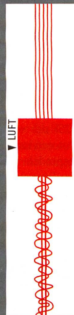
Texturierdüsen HemaJet® für luftblastextu- rierte Garne.

Profitieren Sie von unserer langjährigen Erfahrung, innovativem Engineering und bewährten Produkten. Diese Kombination macht Heberlein zu Ihrem kompetenten Partner in Sachen Schlüsselkomponenten für Luftverwirbelung und Luftblastexturierung. Wir finden auch für anspruchsvolle Aufgaben stets die beste Lösung.