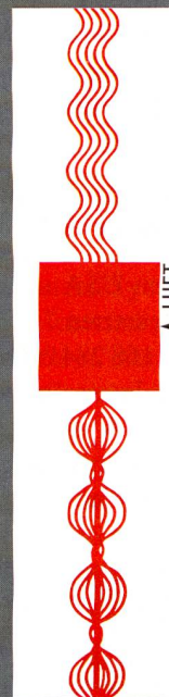
Luftverwirbelungs- düsen für alle Garnbehand- lungsprozesse.