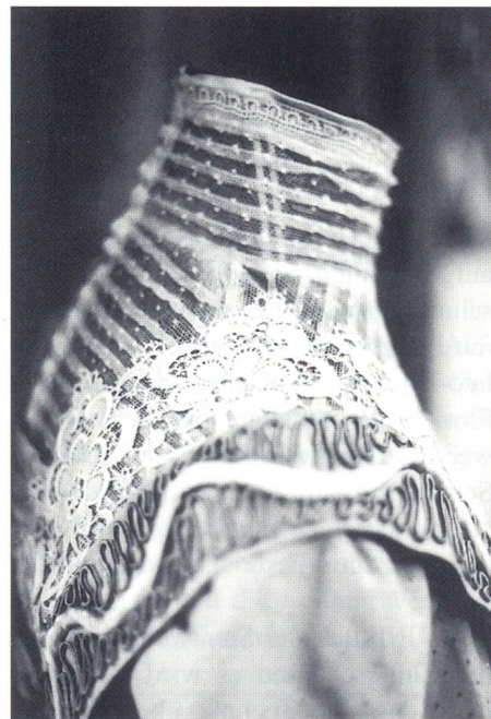
Anmut und Eleganz

«Anmut und Eleganz» zu sehen: Spitzen in der Damenmode von der Jahrhundertwende bis zu den 1960er Jahren. Für jede Robe war eine individuell gefertigte Figurine notwendig. Anhand einer kleinen Dokumentation ist ersichtlich, wie diese Figurinen in aufwendiger Handarbeit im hauseigenen Atelier entstanden sind. Zum Teil waren die gleichen Exponate bereits im Sommer 1995 in Dortmund in der Ausstellung «Spitze – Luxus zwischen Tradition und Avantgarde» (mittex 5/ 1995, S. 46) zu sehen. Dazu sind erstmals aus dem der Textildbibliothek geschenkten Nachlass von Walter Niggli (1908–1990) Modezeichnungen ausgestellt. Es ist eine Auswahl aus den 7500 Originalen, die den Kleiderstil der grossen Couturiers von 1933 bis 1985 widerspiegeln. Die letztjährige Ausstellung «Stickereiindustrie und Stickereientwurf um