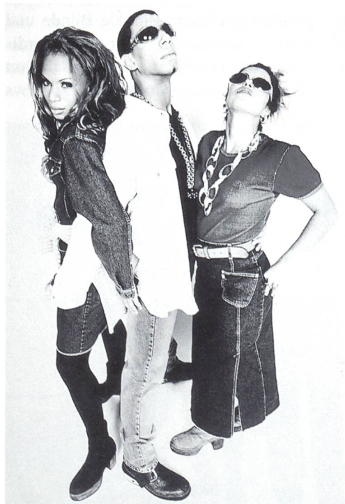
Mustang Herbst/Winter 96/97