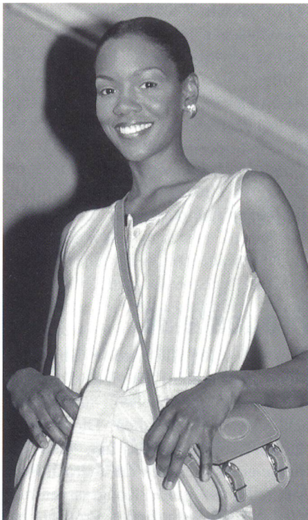
Mit konsequent natürlicher Kleidung in den Sommer 1996

sind zeitlos, langlebig, kombinierbar und lassen sich auch in einem darauffolgenden Jahr mit weiteren Stücken ergänzen. In Zusammenarbeit mit Universitäten und Instituten werden laufend weitere Naturprodukte erforscht, wie zum Beispiel Nessel- und andere Fasern, Pflanzenfarben und anderes.