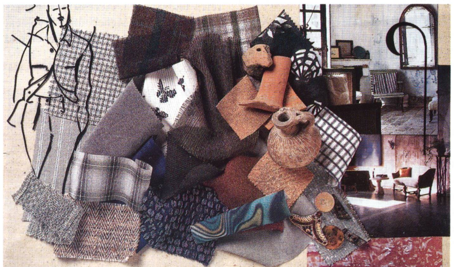
Interstoff World: Sensible

Farben: leuchtend in Multicolor und weiss Stoffe: technische Materialien, Synthetik, moderner künstlicher Griff Dessins: Computer-Druck, psychedelische Dessinierungen Accessoires: Plastik, Lack, Reissverschlüsse Silhouette: Anklänge an Beach-Future Wear, Siebzigerjahre-Einflüsse