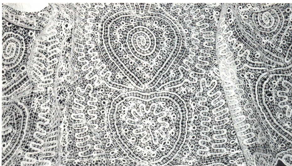
Breite Klöppelspitze aus weissem Leinen

Öffnungszeiten des Museums: Juni bis Oktober: jeweils Dienstag, Donnerstag, Samstag 14.00–17.00 Uhr. Weihnachten bis Ostern: jeweils Mittwoch 14.00–17.00 Uhr. Gruppen nach Vereinbarung.