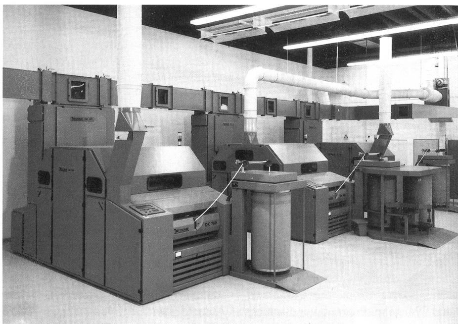
Hochleistungskarde DK 760

Während der letzten Jahre wurden in China über 1000 Hochleistungskarden der DK-Baureihe verkauft.