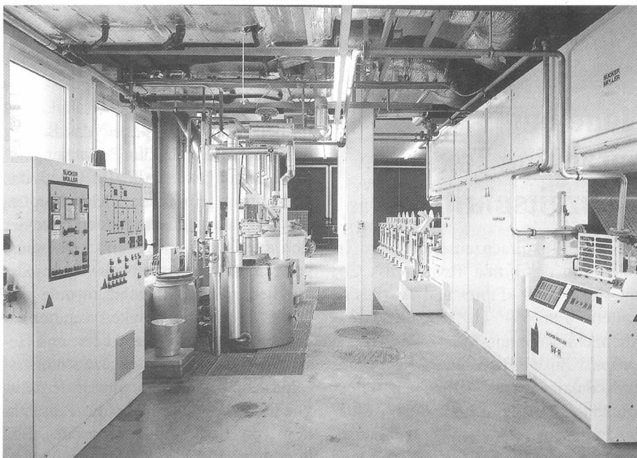
Schlichtekoch- und Überführungsanlage

Reisearrangements: Danzas Reisen AG Tel. 01-809 44 44 Reisebüro Kuoni AG Tel. 01-325 24 30