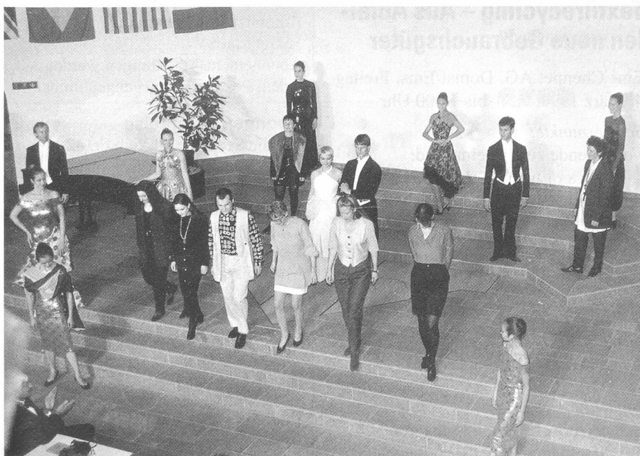
Die Modeschau zum Gala-Diner. Die Entwürfe der Studenten der Schweizerischen Textil-, Bekleidungs- und Modefachschule (STF)

Der 36. Kongress findet vom 4. bis 7. September 1994 in Gent/Belgien statt.