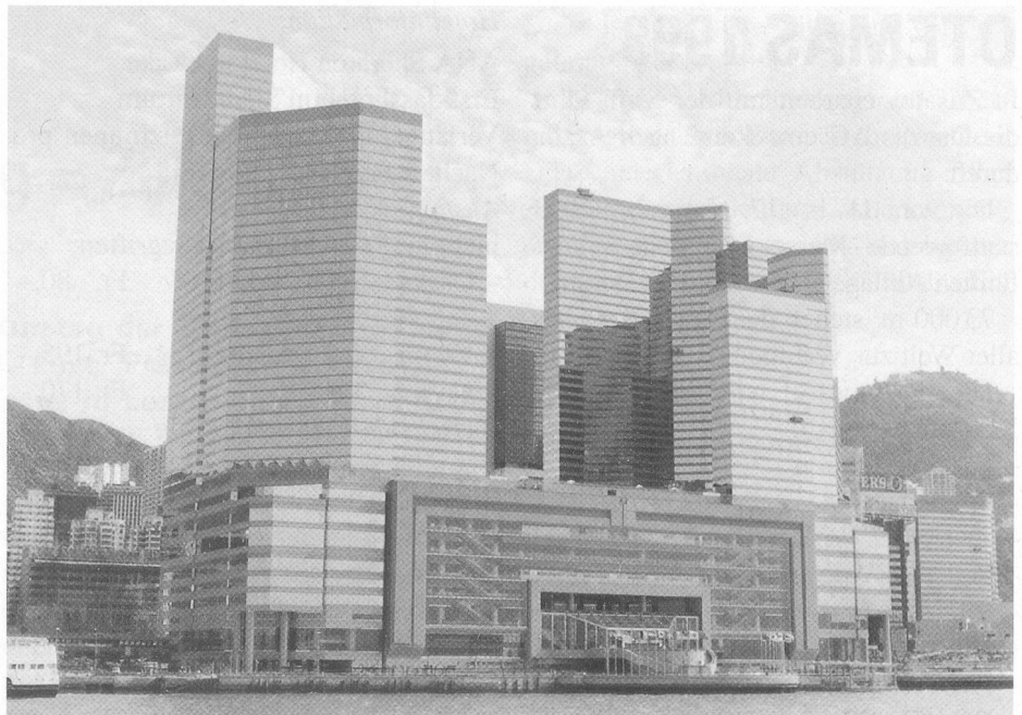
Gesamtansicht des Convention and Exhibition Centre. Das New World Harbour View Hotel ist der vordere Turm auf der linken Seite.

Mittagessen in einem chinesischen Restaurant.