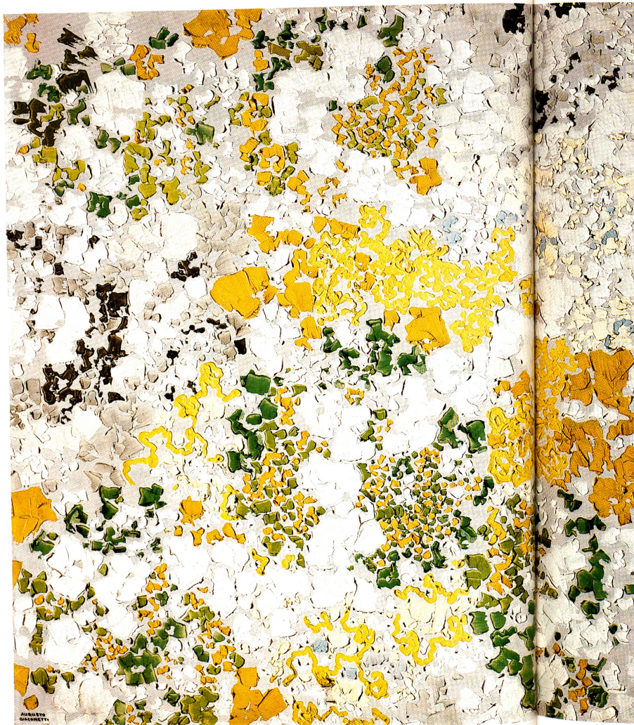
Augusto Giacometti: Eine Besteigung des Piz Duan Öl auf Leinwand, 84,5 x 84 cm Sammlung Kunsthaus Zürich

Sulzer Rüti, Schweiz, Pionier auf dem Gebiet der Webtechnik, stellt Schweizer Künstler vor: