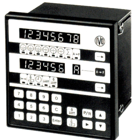
Steuergerät NE 206