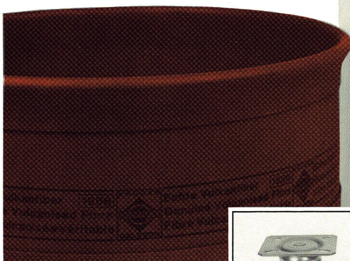
aus echter Vulkanfiber