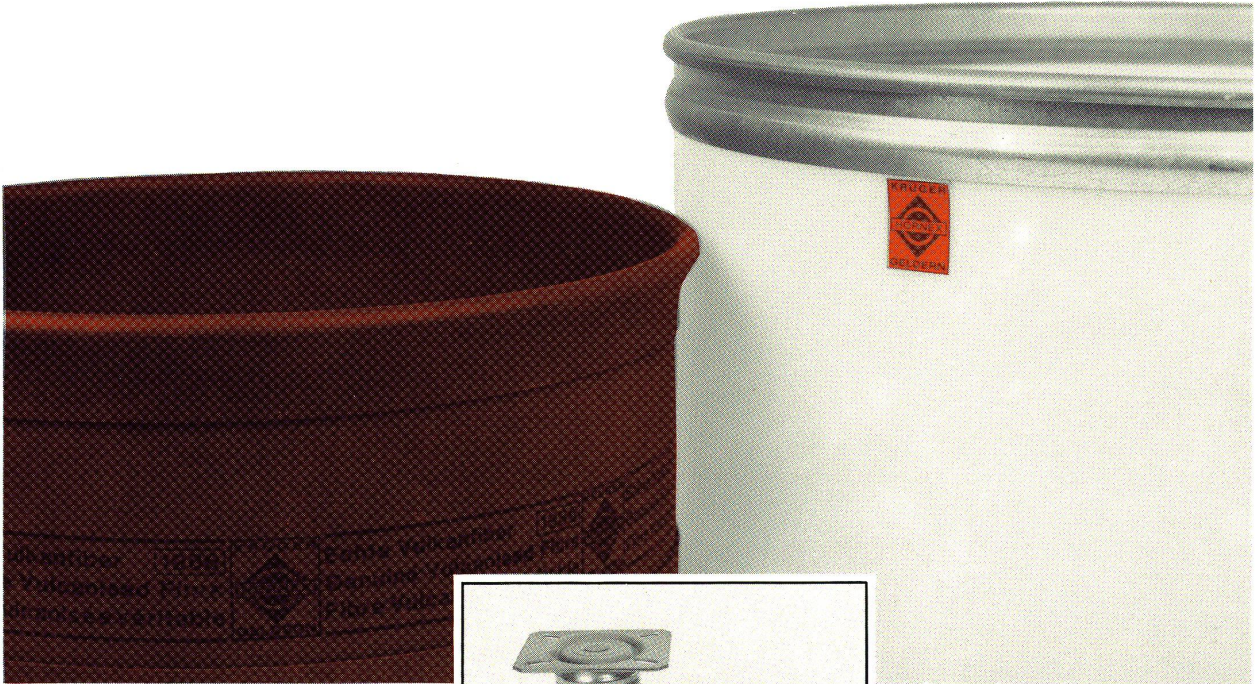
aus echter Vulkanfiber