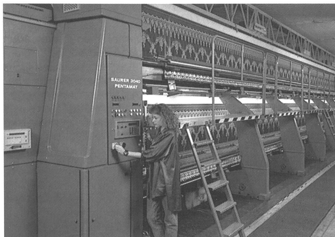
Die Hochleistungsstickmaschine «Saurer 2040» ist Ausdruck der unternehmerischen Haltung der Industrie-Gruppe, ihre Gesundung mit know-how-intensiven High-Tech-Produkten energisch fortzusetzen.

Die Saurer-Gruppe hat ihre Gesundung im Geschäftsjahr 1989 weiter fortgesetzt. Die Saurer-Gruppe Holding AG, Arbon / TG, meldet eine Steigerung des konsolidierten Umsatzes um 20 % auf rund SFr. 360 Mio. und einen Reingewinn von SFr. 25 Mio. Dieser entspricht dem Vorjahresbetrag, was dem Verwaltungsrat erlauben sollte, die gleiche Dividende wie in der vorangegangenen Geschäftsperiode zu beantragen.