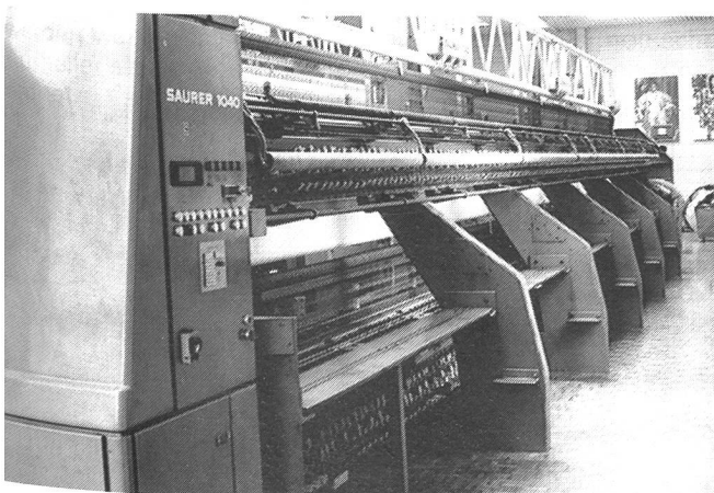
An den Saurer-1040-Einheiten wird das Maschinenterminal in den Schaltschrank integriert.

Die Nachbauer-Entwicklung – das Gerät ist von der dynamischen, erst 1985 gegründeten Firma vollständig für die Stickereiindustrie entworfen und konstruiert worden – hält Urs Isler vor allem für mittlere und grössere Stickereikapazitäten als ein Muss. Das Personal in Heerbrugg hat die Einrichtung übrigens positiv aufgenommen, ein Zeichen dafür, dass es Nachbauer gelungen ist, nicht nur ein praxisgerechtes, sondern auch für die Arbeitskräfte klar lesbares, nicht manipulierbares und für die Beschäftigten im Sticklokal praktisch bedienungsloses, vollautomatisches Gerät zu kreieren. Beim Schichtwechsel bzw. bei Arbeitsschluss werden die erwähnten, relevanten Daten am Hauptgerät selbst ausgedruckt, während die Balkengrafik (siehe Bild) fortlaufend am Gerät erscheint.