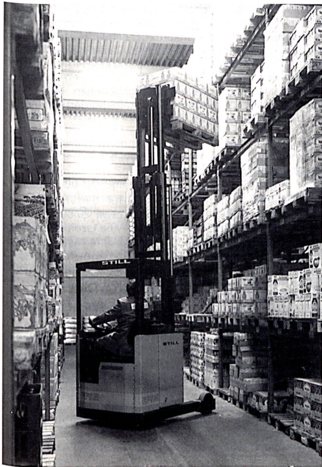
Unter der Typenbezeichnung EFSM stellt Still seine modifizierte Schubmaststapler-Reihe vor. Mit dem entsprechenden Freisicht-Triplexmast – nutzbare Hubhöhe max. 8570 mm – lassen sich praktisch alle vorkommenden Lageraufgaben effektiv und wirtschaftlich lösen.

perhaltung. Ventilhebel für Heben/Senken, Mastvorschub, Mastneigung sowie eventueller Zusatzgeräte und der grossflächige Fahrtrichtungsumschalter befinden sich im ergonomischen Zugriff des Fahrers. Auf einem Display können dem Fahrer verschiedene Funktionen angezeigt werden.