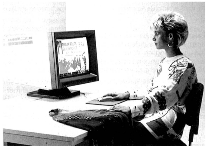
Die Universal-Musterungsanlage MA-7000 als Kompaktarbeitsplatz mit diversen Sonderausstattungen für den individuellen Bedarf.

Die Universal-Musterungsanlage MA-7000 ist ein moderner Programmierarbeitsplatz. Das System dient insbesondere der schnellen Erstellung von Strickprogrammen für computergesteuerte Universal-Flachstrickautomaten. Kreative Gestaltungsmöglichkeiten sind praktisch keine Grenzen gesetzt. Die Anlage kann durch Zukauf handelsüblicher Büromögel individuell angeordnet werden.