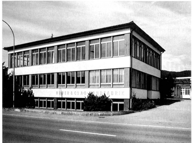
Die Grundfläche der Fabrikliegenschaft beträgt um die 2000 m 2 .

Besonderes Know-how, das im Verlauf der Jahre seit Aufnahme der Lamellentragband-Produktion im Jahre 1961 erworben wurde, mündete in ein gegenwärtig weltweit singuläres und unter Anwendung einer selbst entwickelten Technologie fabriziertes Erzeugnis der Bandweberei. Unter den markenrechtlich geschützten Bezeichnungen «Texband», «Hagofix» und «Hagotex» werden Trag- und Aufzugsbänder für die Storenhersteller mit einzigartigen Eigenschaften produziert. Beim «Texband» (Aufzugsband) wird das 0,27 oder 0,33 Millimeter breite, auf Schifflimaschinen gewobene Band mit einer Beschichtung ummantelt, um ein Aufscheuern beim Gebrauch zu verhindern. Für einen störungsfreien