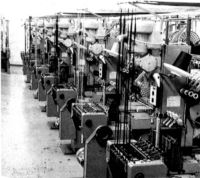
Modernste Technologie steigert Flexibilität, Qualität und Produktivität. Superschnelle Webautomaten (bis zu 3000 Schusseintragungen/min) sind Voraussetzung für ein gutes Preis-/Leistungs-Verhältnis.

Ende letzter Woche erreichte uns nun die lakonische Mitteilung, dass die Ende August aus Moskau erhaltenen Zahlen