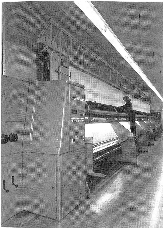
5 Maschinen des Typs Saurer 1040 mit 15 Yards Sticklänge werden in Kürze Stickereien in «Saurer-Qualität» produzieren.

Im März 1985 erhielt Saurer eine Offertanfrage aus der UdSSR über Stickmaschinen des Modells 1040. Das Projekt war für einen Betrieb bestimmt, der bereits über 6 Zangs-Maschinen im Plauen-System verfügt. Es ging somit darum, das Problem der Systemverschiedenheit zu den Saurer-Maschinen zu lösen.