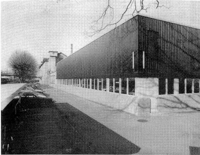
Aussenansicht der Betriebsstätte mit der vor kurzem in Betrieb genommenen neuen Speditionshalle

Zwischen der 1888 erfolgten Gründung der «Bleicherei Rorschach» auf dem Gelände der Liegenschaft «Neuseeland» am Bodensee in Rorschach, durch den aus Deutschland stammenden Carl Kopp und der heutigen Firma Kopp AG Textilveredlung liegen 100 Jahre. Gerade rechtzeitig zu dieser Zentenarfeier konnte das Lohnveredlungsunternehmen die bauliche Sanierung der Altbauten, sowie einen umfangreichen Erweiterungsbau abschliessen. Mit einher ging eine Modernisierung des Maschinenparks, der heute ein Durchschnittsalter von nur 4 bis 5 Jahren aufweist. Das Unternehmen hat sich zudem erstmals auch der Fach- und Tagespresse im Rahmen einer kleinen Feier geöffnet, verbunden mit einem Betriebsrundgang. Wir benützen die Gelegenheit gerne, das aktive und expansive Unternehmen in unserer Serie «mittex-Betriebsreportage» etwas näher vorzustellen.