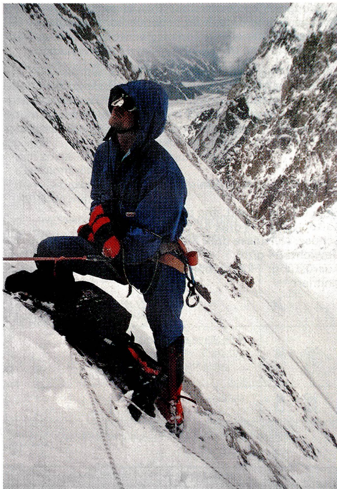
Pertex-Arktis Windanzug aus 100% Nylsuisse. Stoffhersteller: Perseverance Mills Ltd., GB-Padiham Konfektionär: Arktis Outdoor Products, GB-Exeter

W. Schlafhorst & Co. D-4050 Mönchengladbach