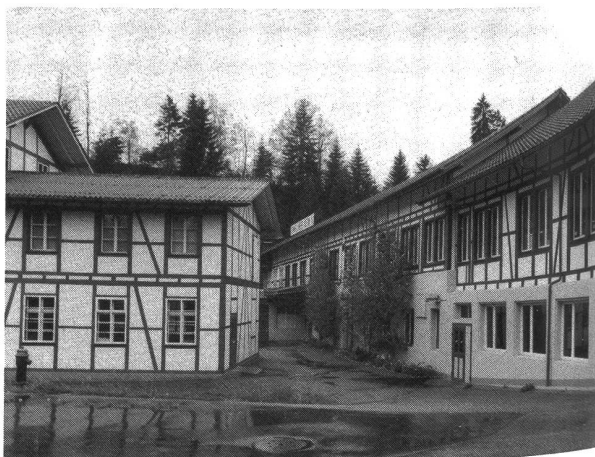
Teilansicht der Spinnerei und Weberei Rüderswil AG

Gegründet wurde die Spinnerei und Weberei Rüderswil AG anno 1862, um einheimischen Flachs zu spinnen. Die Weberei wurde der Spinnerei erst Jahrzehnte später angegliedert. Heute werden neben Flachs und Hanf auch Baumwolle, Ramie, Kunstfasern und etwas Wolle verarbeitet. Gewoben werden Haushaltstextilien für Spitäler, Heime und für das Gastgewerbe. Übrigens waren lange Zeit Aussteuern für Verlobte der grosse Hit – bis in die 70er-Jahre.