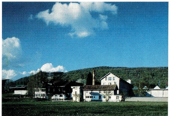
Die 1825 gegründete Seidenweberei Weisbrod-Zürrer AG, Hausen am Albis