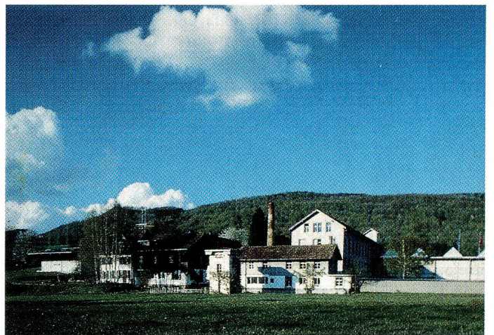
Die 1825 gegründete Seidenweberei Weisbrod-Zürrer AG, Hausen am Albis