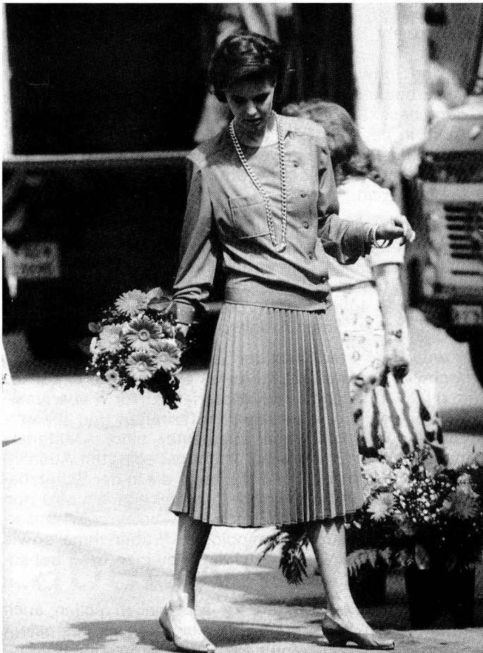
Geranienrotes Tersuisse-Deux-pièces aus seidigem Jersey. Das kragenlose, blousonartige Oberteil ist asymmetrisch geschlossen und wird durch einen beschwingten Sonnenplisséjupe ergänzt.

Ein neues Körperbewusstsein, d.h. zurück zur Feminität, das Unterstreichen weiblicher Rundungen und Sinnlichkeit sind wieder gefragt.