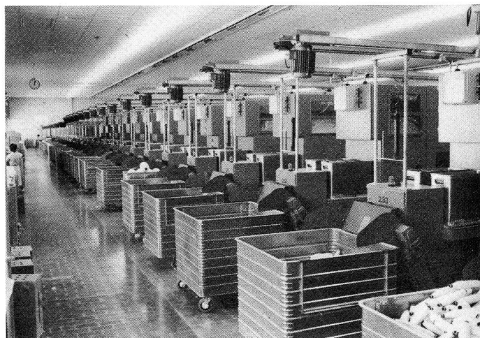
Bild 1 Einer der beiden Ringspinnssäle im Neubau mit Zinser-Ringspinnmaschinen und Doffer