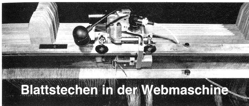
Blattstechen in der Webmaschine

Ohne Probleme mit der neuen Webeblatt- Einziehmaschine 83