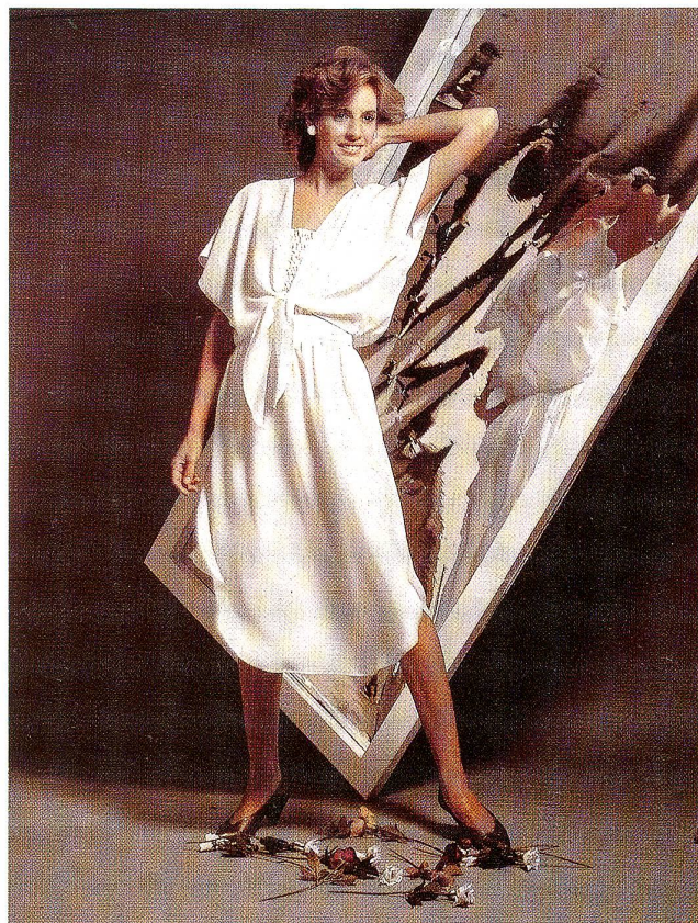
Dreiteiliges, weisses Tersuisse-Kleid: Die elastisch, gesmoke Corsage wird durch das geknotete Oberteil und dem raffinierten Wickeljupe ergänzt.

Die Abendmode gibt sich kostbar und prunkvoll. Die Schnitte sind einfach und raffiniert und überlassen den Stoffen das Brillieren.