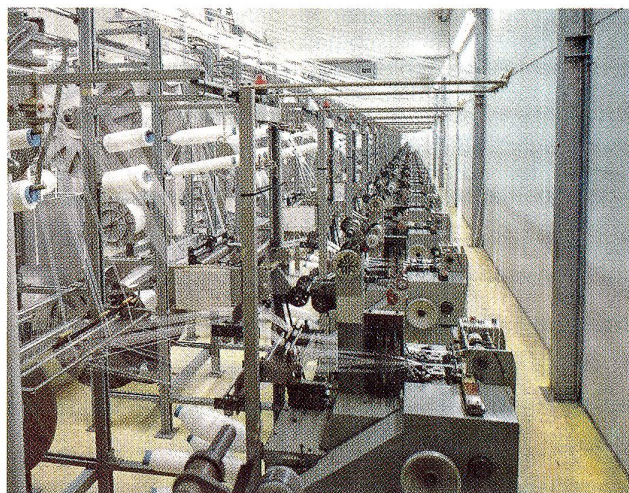
In der Weberei sind insgesamt 75 Webmaschinen installiert

Unter den schweizerischen Bandwebern nimmt das Küttiger Unternehmen einen hervorragenden Rang ein, das gilt in Beziehung auf den in jeder Beziehung modernen Webmaschinenpark und die zweckmässig für die besonderen Bedürfnisse des Hauses adaptierte eigene Färberei und Ausrüsterei. In historischer Beziehung bleibt zu resümieren, dass man anfänglich glatte Baumwollbänder fabrizierte, anschliessend gesellten sich Plüschbänder für die Mieder-, Corset- und Schuhindustrie dazu. In erster Linie als Folge der Kriegswirren erweiterte sich das Sortiment auf breite Ware, ferner zählten (Ski-) Steigfelle zu den wichtigeren Artikeln, die von Küttigen aus Verbreitung in den Alpenländern fanden. Mitte der sechziger Jahre folgte dann erneut die Spezialisierung auf ausschliesslich Schmalgewebe; hergestellt wurden aber stets nur Florgewebe. Ein entscheidender Schritt erfolgte mit der Einrichtung einer eigenen Strangfärberei und Ausrüsterei, was den Einstieg in das modische Samtband ermöglichte. Anfang der siebziger Jahre wurde die erste, nach eigenen Entwürfen hergestellte Mageba-Continue-Anlage installiert.