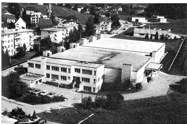
Gesamtansicht des Betriebsgebäudes der Salzmann Stretch in Wald (ZH), im Vordergrund der Bürotrakt und die Strickerei, im Hintergrund der 1984 realisierte Neubau.

Die Firma Salzmann AG, St. Gallen, die auf eine über 100jährige Geschichte zurückblicken kann, wurde ursprünglich als Baumwollspinnerei und -zwirnerei gegründet. Heute verfügt das diversifizierte Familienunternehmen über mehrere als Profit-Centers organisierte Abteilungen. In den Bereich der Zwirnerei, genauer der Umspinnerei, tritt dabei der Betrieb Salzmann Stretch AG in Laupen bei Wald (Kt. Zürich) in den Vordergrund