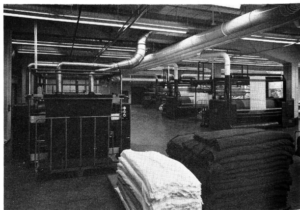
Teilansicht in der Ausrüsterei, rechte Bildhälfte Rohmaschinen, links Schermaschinen

Die Textilveredlungsabteilung, die am Gesamtumsatz heute zu 40 Prozent partizipiert, war ursprünglich, im Einklang mit der Entwicklung der Wirkerei-/Strickereiindustrie als Kettstuhl-Lohnveredlungsbetrieb konz-