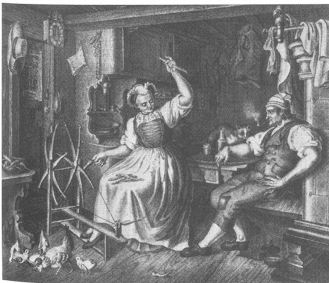
Die Spulerin Lithographie von Ludwig Vogel (1788–1879)

Bevor mit dem Weben begonnen werden kann, müssen verschiedene Vorarbeiten getan werden, die Goethe in den «Wanderjahren» auf das Genaueste beschreibt: