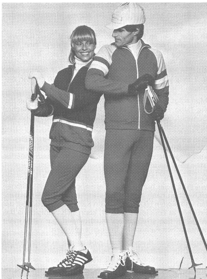
Zwei atmungsaktive und temperatenausgleichende Nylsuisse-Langlaufanzüge in Lackrot mit Baumwollabseite, für den Herrn mit grauen und weissen Einsätzen, für die Dame mit marine und weissen Kontrastpartien. Die zweiteiligen Modelle werden von hochgeschnittenen, die Nierenpartie schützenden Hosen begleitet. Modelle: Merboso AG, CH-8902 Urdorf Mütze: Fürst AG, CH-8820 Wädenswil