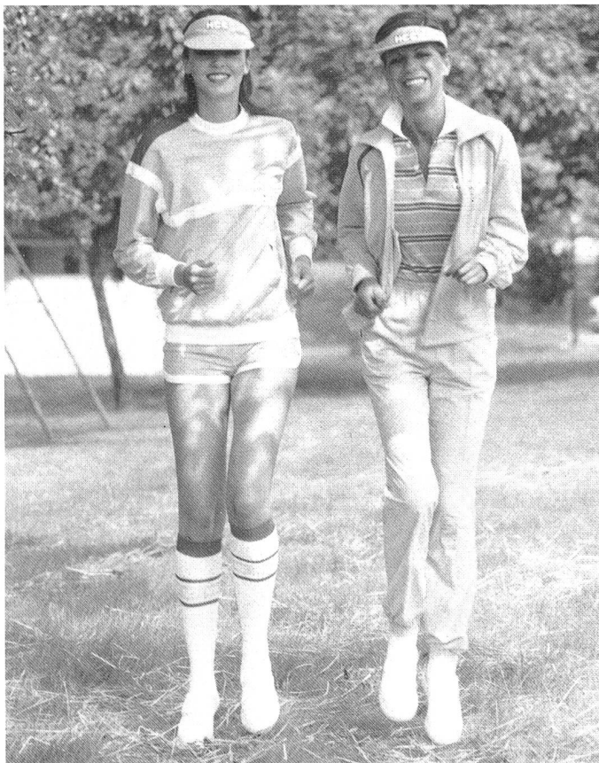
HCC Jogging – Links: Sweat-Shirt PLAIN, 100% Polyester; Shorts SAMBIN, 100% Polyester; Kniestrümpfe CHAMIL – Rechts: T-Shirt TAINAN, 100% Coton; Training TRAQUE, 100% Polyester; Schild GAVOTI.

Zu bemerken, ein ganz neuer wildlederartiger Stoff «peau-de-pêche», sowie Frottéestoffe und innen aufgerauhte Baumwollstoffe, die sich alle ganz besonders für diesen im Freien praktizierten Sport eignen. Der Trainingsanzug TRAQUE in seiner neuen raffinierten Farbe «champagne» ist ein perfektes Beispiel dieser dynamischen Linie.