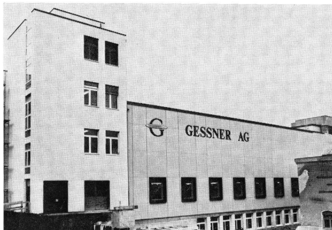
Dank dem Weberei-Neubau zählt die Weberei Gessner AG Wädenswil heute zu den modernsten und leistungsfähigsten Jacquard-Webereien der Welt.