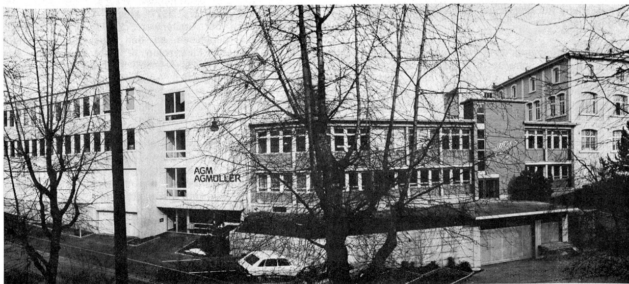
Fabrikations- und Bürogebäude

Ebenso sind für die Ausrüstung der Spielkarten sowie für die Herstellung der Bahnbillette und Webmaschinen-Steuerungspapiere verschiedene Spezialmaschinen erforderlich. Da diese auf dem Maschinenmarkt nicht erhältlich sind, müssen sie von der AG Müller in eigenen Werkstätten selbst gebaut werden.