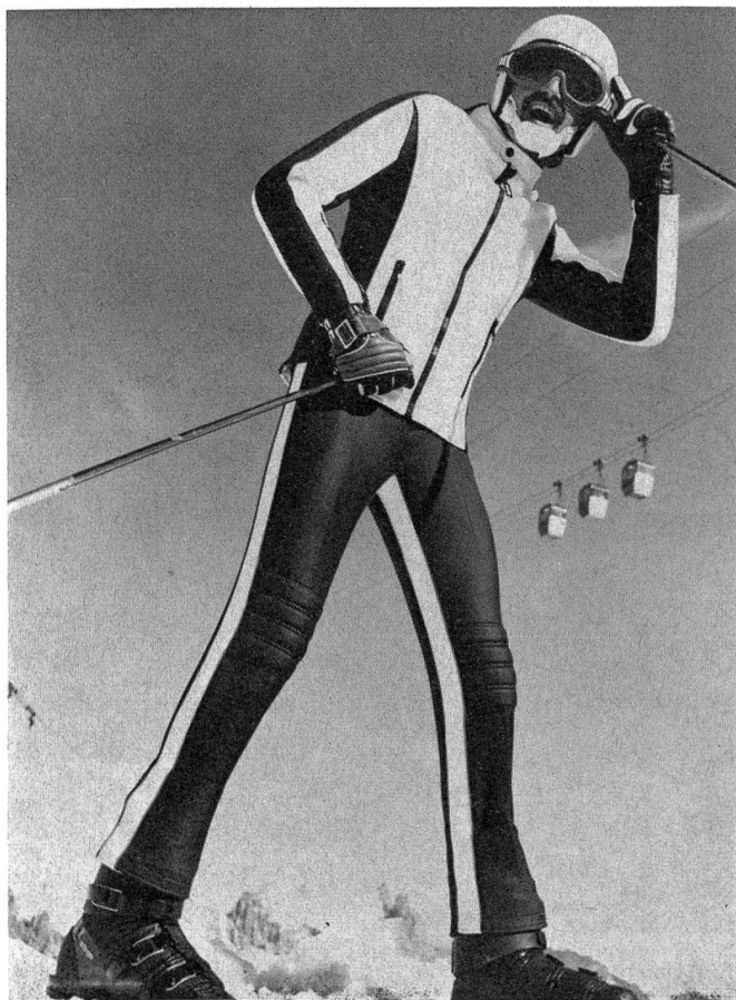
Rennanzug für Herren, aus Skifans Stretch von Schoeller-Textil.

Aus diesem Grund kann die Zettelanlage MZD/Z 25 weltweit wirtschaftlich eingesetzt werden (Abbildung 2).