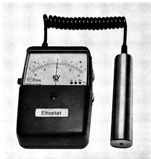
Abbildung 5 Eltex-E-Feld-Messgerät EM 01. Handliches Klein-gerät mit separater Messsonde zum Messen elektrostatischer Aufladungen an Fäden und Bahnen.

Auch durch die Verwendung eines speziellen Pulvergemisches (Schwefel und Mennige) — mit dem das zu untersuchende Material bestreut wird — kann der Nachweis von statischer Elektrizität geführt werden. Durch Schütteln (Coehnsche Regel) laden sich die Schwefel negativ und die Mennige positiv auf. Die Schwefelteilchen haften an den positiv und die Mennige an den negativ geladenen Stellen der Oberfläche. Auf diese Weise lässt sich auch sichtbar machen, dass Materialien auf der einen Seite möglicherweise positiv