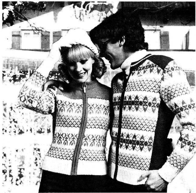
Folkloristische Dessins sind in dieser Wintersaison dominierend. Wenn diese dann noch auf schicken Blousons aus reiner Schurwolle erscheinen, dann ist die modische Aktualität garantiert. Wollsiegel-Modelle: Peter Geiger; Foto: Wollsiegel-Dienst/Stock.

erobert, als Top-Modell für die rasanten Abfahrtsläufer und die ausdauernden Langläufer. Und gerade im Skilauf, der dem Wintersport zu einer noch breiteren Popularität verholfen hat, ist der Blouson genau das Richtige, insbesondere dann, wenn er aus reiner Schurwolle gestrickt ist. Denn Strickblousons machen jede Bewegung mit, sind bequem und leicht und wenn sie das Wollsiegel-Etikett tragen, dann garantieren sie auch noch den höchsten Tragekomfort, wie ihn nur die Naturfaser Wolle bieten kann. Ihre spezifischen physiologischen Eigenschaften sorgen dafür, dass man sich in Schurwollstricksachen wie in einer zweiten Haut, also wohlfühlt.