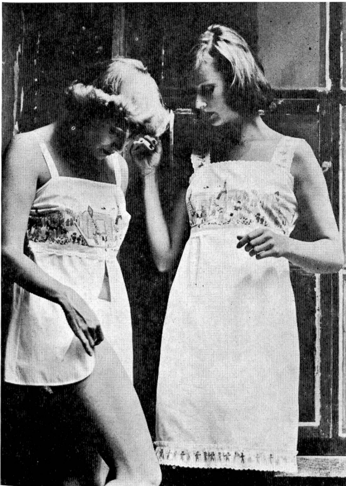
Bunte Motive aus dem Kinderbuch und feine Stickereibänder zieren das knappe Hemdchen – mit passendem Slip – und das Hängerchen aus weissem Baumwoll-Batist. Modelle Mylady – Stickerei Jacob Rohner.

Für feminine Eleganz sorgen die zahlreichen Modelle aus feinstem Baumwoll-Batist, Edelcrêpe oder transparentem Voile mit Spitzen an tiefen Décolletés, gerafften Büsten teilen, schmalen Trägerchen und taillierenden Stickereien.