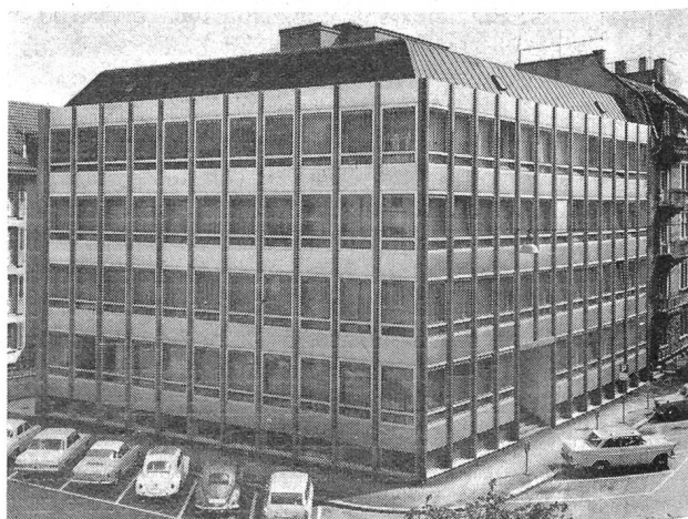
Neubau der Firma Adolphe Bloch Söhne AG, Zürich (ABZ), Tochterfirma der Weberei Wängi AG

Aus der Diskussion der Besucher bei einer Erfrischung nach dem anstrengenden zweistündigen Rundgang konnte man allgemeine Befriedigung über die Entwicklung des gemeindegrössten Unternehmens, gepaart mit Verständnis für die Probleme und Anerkennung für die Leistung der Textilindustrie, heraushören. Damit wurden Sinn und Zweck dieses Besuchstages voll erfüllt. (jm)