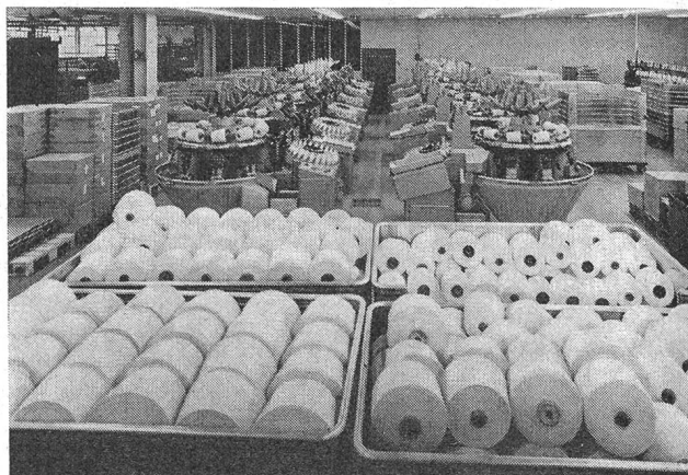
Automatenspulerei (Schweiter-Rundautomaten CA-11)

Besonders eindrücklich und instruktiv sind aber eine grössere Anzahl von Graphiken, welche die Entwicklung des Unternehmens aufzeichnen. Das Stammhaus in Wängi, wel-